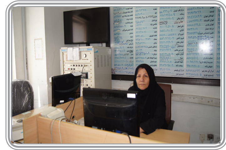
مسئول مرکز تلفن مرکز در گفتگو با روابط عمومی اعلام کرد:

همچنین در حال حاضر امکان برقراری ارتباط با این سیم کارتهای تالیا در خارج از مرکز نیز برقرار است چرا که امواج در سطح شهر تهران و شهرستانهای دیگر از طریق دکلهای همراه اول تقویت می گردد. مسئول مرکز تلفن بیمارستان در پایان خاطر نشان کرد: در حال حاضر ۵۰ خط تالیا با شماره های ۴ رقمی برای ارتباط داخلی در اختیار پزشکان، برخی مدیران و مسئولین قرار دارد که رضایتمندی همکاران را در پی داشته است. وی همچنین از زحمات و تلاشهای مدیران و مسئولین ذیربط بیمارستان به خصوص مسئولین اداری و خدمات تشکر کرد.