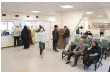
پذیرش بیمارستان دکتر مسیح دانشوری

۵- لطفاً به ساعت و روز ثبت شده در پیامک دقت فرمائید. در غیر از روز و ساعت تعیین شده در پیامک، پذیرش انجام نمی شود.