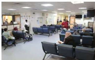
درمانگاه بیمارستان دکتر مسیح دانشوری