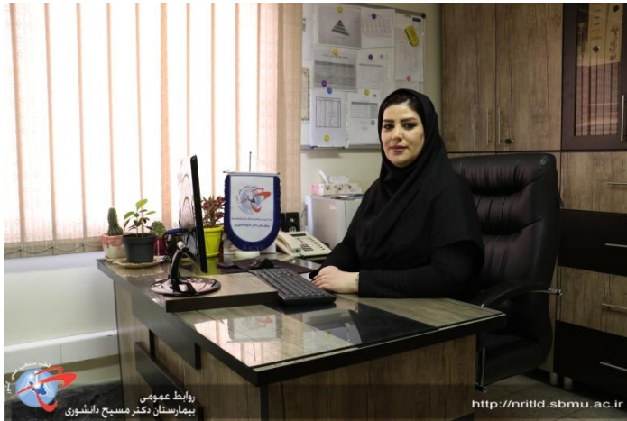
روابط عمومی بیمارستان دکتر مسیح دانشوری